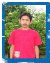
Yudi Indonesia 28 febbraio 1993